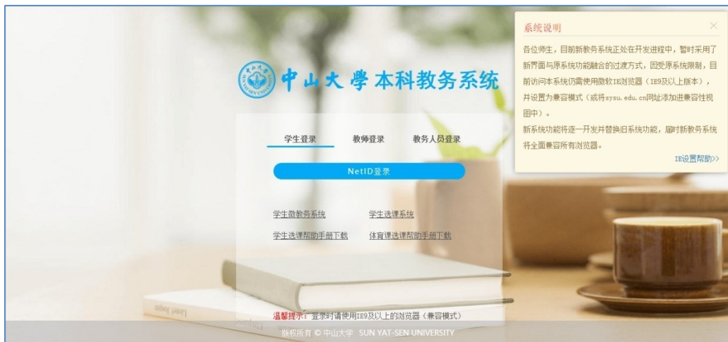
图 1 本科教务系统登录界面

打开浏览器在地址栏输入新本科教务系统访问地址： https://jwxt.sysu.edu.cn/ ，进入教务登录界面（使用 netID 登录）如图 1 所示：