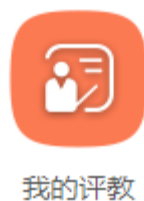
图 2 “我的评教”图标

登录教务系统后，在所有服务中点击“我的评教”图标，进入课程列表列表界面，如图 2、图 3 所示：